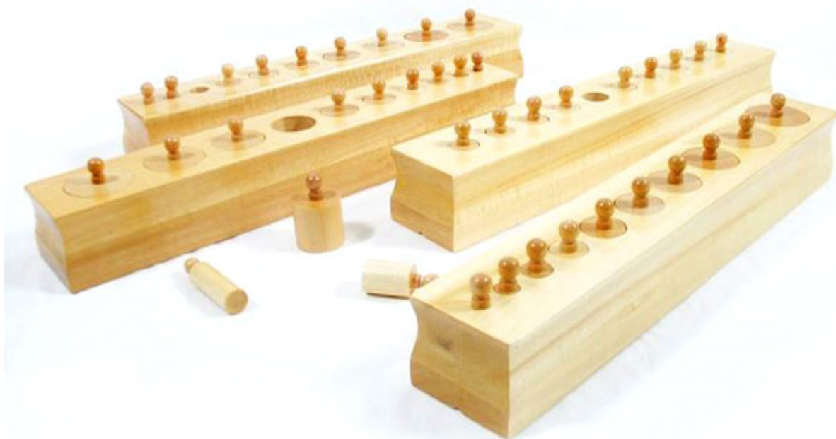
Zobacz: Cylindry do osadzania