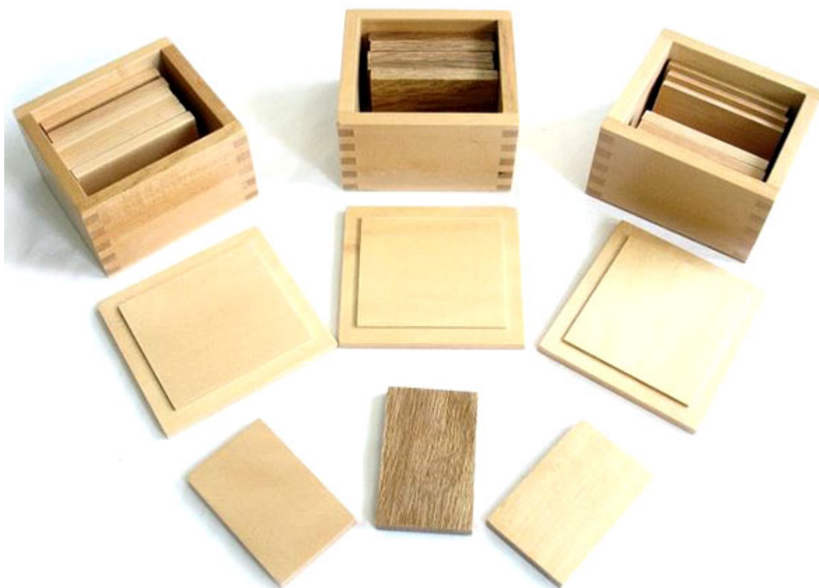
Zobacz: Tabliczki baryczne w pudełku